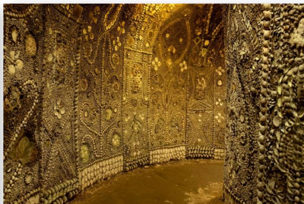
Грот из ракушек