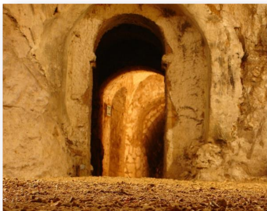
Пещеры «Адского Пламени»