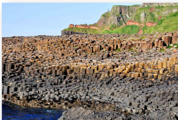
Тропа Гигантов в Северной Ирландии