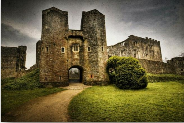
Замок Бэри Полумрой